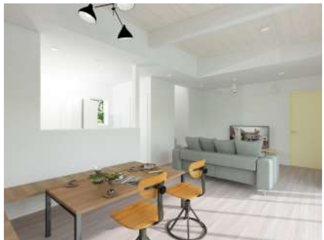
サニーサイドハウスⅢ 内観イメージ