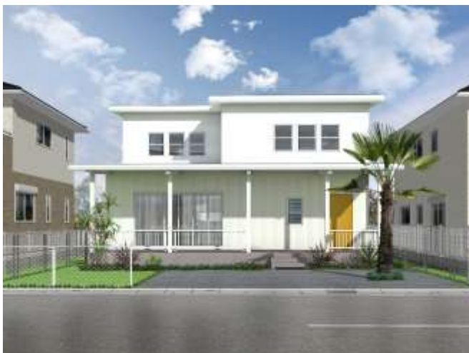
サニーサイドハウスⅢ 外観イメージ