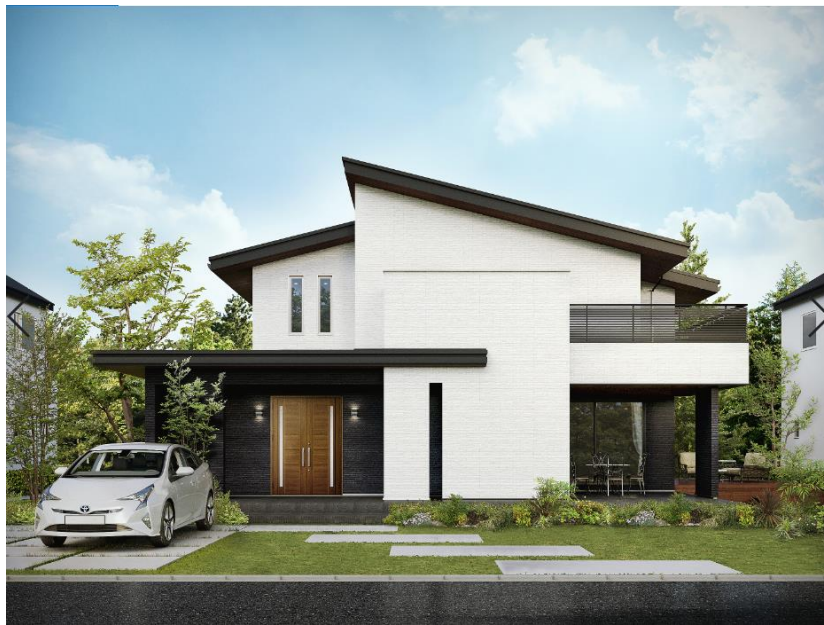
「クラージュ G-Classe」外観イメージ

「環境設計の家」を掲げて、注文住宅の販売や FC 事業、リフォーム事業、不動産事業等を展開するアエラホーム株式会社(以下:アエラホーム 東京都千代田区/代表取締役社長 中島鷹秀)は2020年1月4日(土)より、国内最高水準の HEAT20 G2 基準※1 に対応した「クラージュ G-Classe (ジークラッセ)、以下:クラージュ G-Classe」の販売を開始いたします。