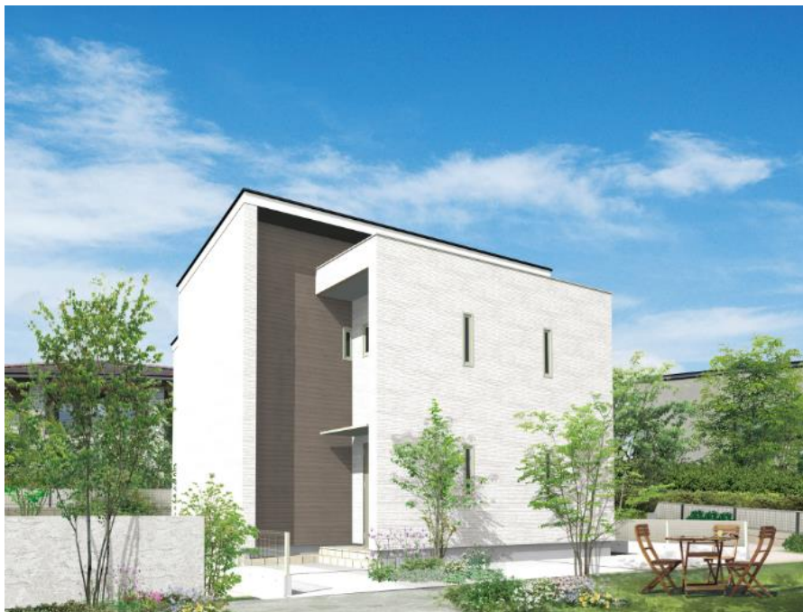
「2.5階建ての家」外観イメージ

「2.5階建ての家」、「1.5階建ての家」は、小屋裏スペースをセカンドリビングや書斎、子ども部屋やプレイルームなど、アイデア次第で様々な使い方が可能になる高性能住宅です。